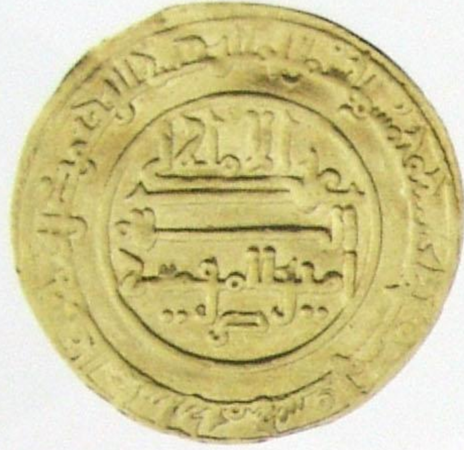
دينار مرابطي علي بن يوسف ضرب: مرسية سنة: ٥٠٢ هجري

Murabteen Dinar Ali Bin Yosef struck at Mrseya Year: 502 H